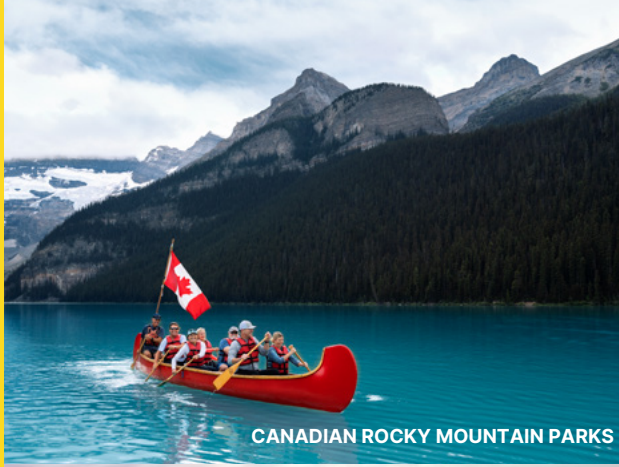
CANADIAN ROCKY MOUNTAIN PARKS

서쪽으로는 밴프와 재스퍼를 포함한 캐나다 로키 산맥의 장대한 자연이 펼쳐지고, 남쪽으로는 워터튼-글레이서 국제 평화공원과 헤드-스매시드-인 버팔로 점프, 라이팅-온-스톤 주립공원이 이어집니다. 동쪽에는 공룡 주립공원까지 자리해 유네스코 유산을 여행할 때 캘거리는 완벽한 베이스캠프입니다.