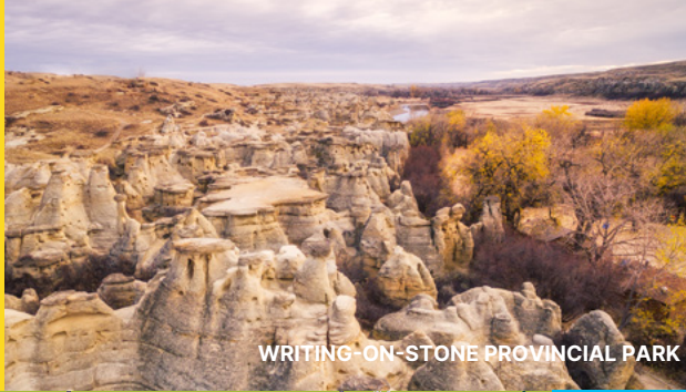
WRITING-ON-STONE PROVINCIAL PARK