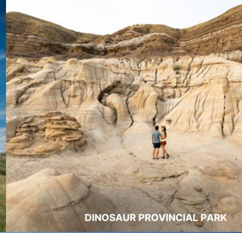
DINOSAUR PROVINCIAL PARK