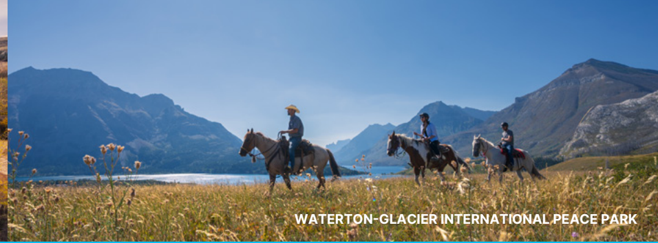
WATERTON-GLACIER INTERNATIONAL PEACE PARK