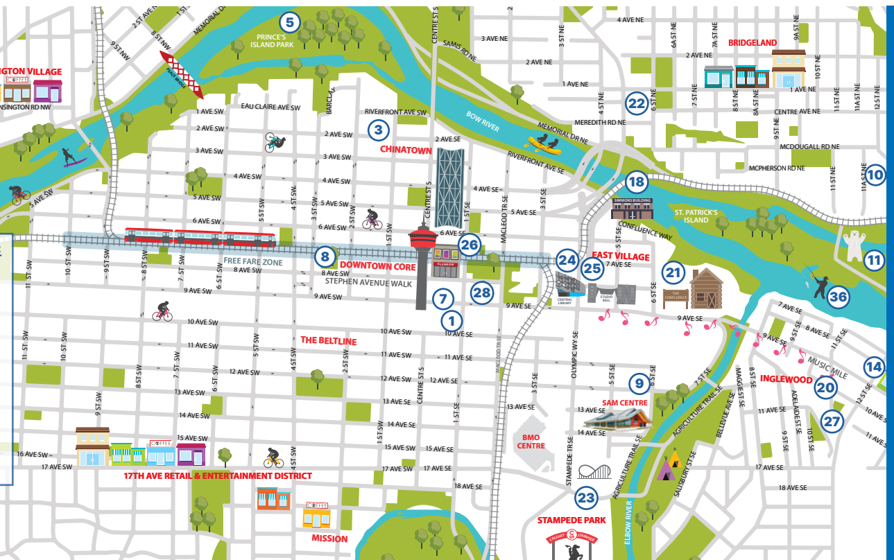
워커투드 센터 (이전: 아츠 커먼스) 예술과 문화가 살아 숨 쉬는 활기찬 중심지로, 이곳에는 다섯 개의 극장과 세계적 수준의 콘서트 홀이 마련되어 있습니다. 음악과 연극은 물론 영화, 무용, 시각 예술까지 다양한 장르가 어우러지며 창의성이 꽃피는 공간입니다.