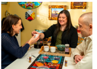
몬스톤 크리에이션 잉글우드에 위치한 이 원주민 소유 캘거리에서는 비즈 공예, 리본 스카프, 회화 작품, 주얼리 등 다양한 예술품을 선보입니다. 또한 전통 기법을 배우는 클래스도 운영되며, 방문객들은 원주민 예술과 문화를 직접 체험할 수 있습니다.