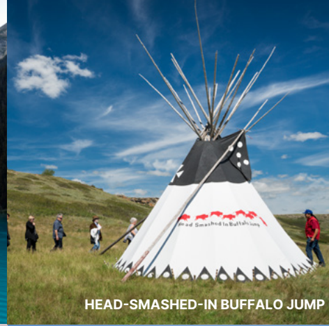
HEAD-SMASHED-IN BUFFALO JUMP