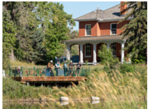
잉글우드 새 보호구역 캘거리 다운타운에서 단 몇 분 거리, 아름다운 산책로와 다양한 야생 조류, 그리고 숲속에서의 힐링 경험을 즐길 수 있는 평화로운 도심 속 자연 휴식처, 잉글우드 새 보호구역에서 자연과 다시 연결되는 시간을 만나보세요.