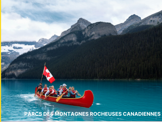
PARCS DES MONTAGNES ROCHEUSES CANADIENNES

Parcourez les parcs des Rocheuses canadiennes, notamment Banff et Jasper à l'ouest, le Parc international de la paix Waterton-Glacier, le précipice à bisons Head-Smashed-In et le Parc provincial Writing-on-Stone au sud, sans oublier le Parc provincial Dinosaur à l'est, qui font de Calgary le parfait camp de base pour partir à la découverte d'un patrimoine extraordinaire.