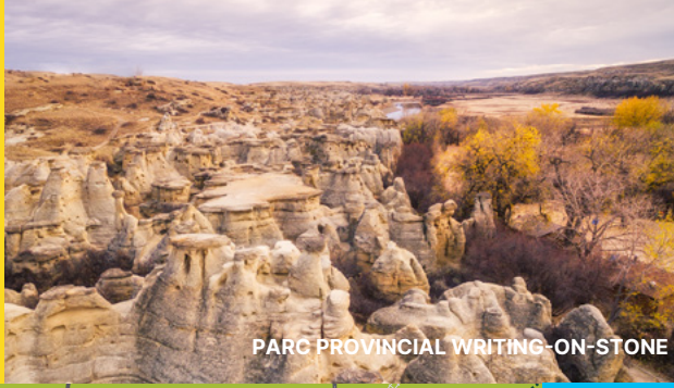
PARC PROVINCIAL WRITING-ON-STONE