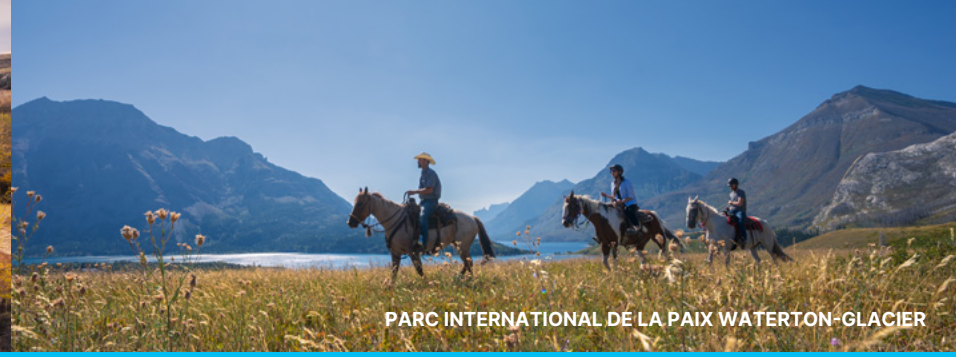
PARC INTERNATIONAL DE LA PAIX WATERTON-GLACIER