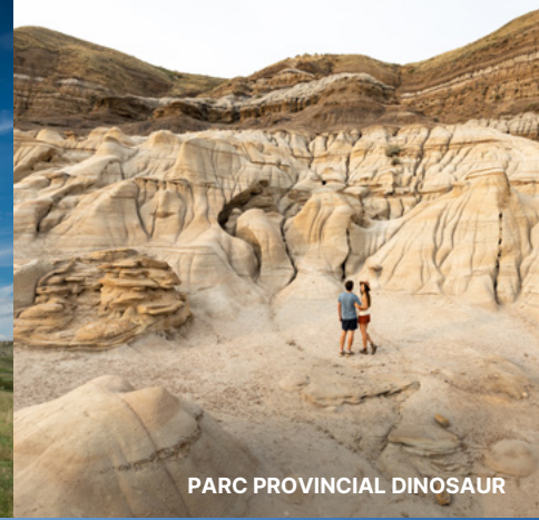
PARC PROVINCIAL DINOSAUR