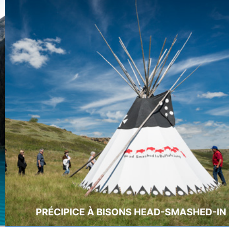
PRÉCIPICE À BISONS HEAD-SMASHED-IN